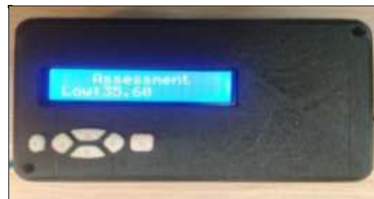
شکل ۴. نمونه‌ای از نتیجه نهایی ارایه شده توسط دستگاه سنجش بار کاری فیزیکی

جدول ۱، دو روش برآورد درجه بار کاری فیزیکی به وسیله دستگاه و با روش دستی را از نظر امتیاز کاربردپذیری سیستم و مدت زمان مورد نیاز مقایسه می‌کند. بیشترین و کمترین امتیاز کاربردپذیری ثبت شده برای دستگاه ساخته شده به ترتیب ۷۹ و ۹۵ و میانگین نمره کاربردپذیری این سیستم برابر با ۸۴/۶ برآورد گردید که مطابق با شکل ۲، در محدوده B و کاربردپذیری خیلی خوب قرار گرفت؛