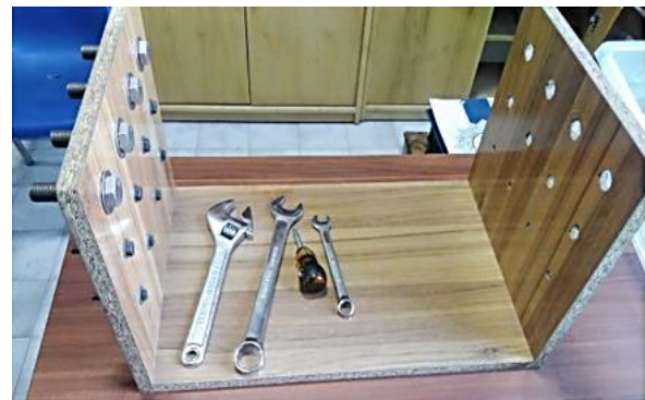
شکل ۱. مجموعه ابزار اندازه‌گیری چابکی کل دست با تست Bennett

نرمال بودن توزیع داده‌ها با استفاده از آزمون Shapiro-Wilk ارزیابی و آزمون مناسب انتخاب گردید. جهت مقایسه نمره چابکی کل دست بین دستکش‌ها و حالت بدون دستکش، از آزمون ناپارامتریک Wilcoxon استفاده شد. به منظور مقایسه نمره چابکی و ناراحتی موضعی بین دستکش‌ها، از آزمون One-way ANOVA و در صورت معنی‌داری، از آزمون Bonferroni (SPSS نسخه ۲۴، IBM version 24) استفاده گردید. داده‌ها در نرم‌افزار