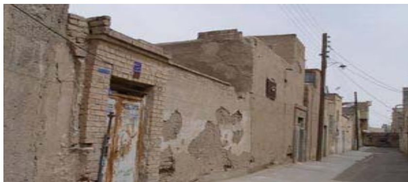
شکل ۲: منطقه ۱۲ تهران (منبع: وزارت راه و شهرسازی، ۱۳۹۰)