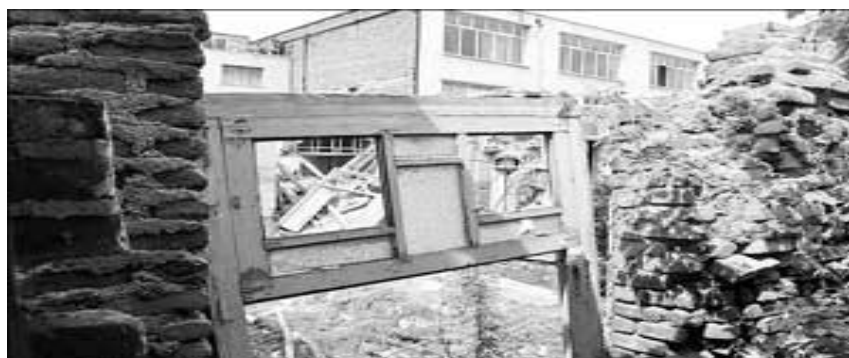
شکل ۳: منطقه ۱۲ تهران