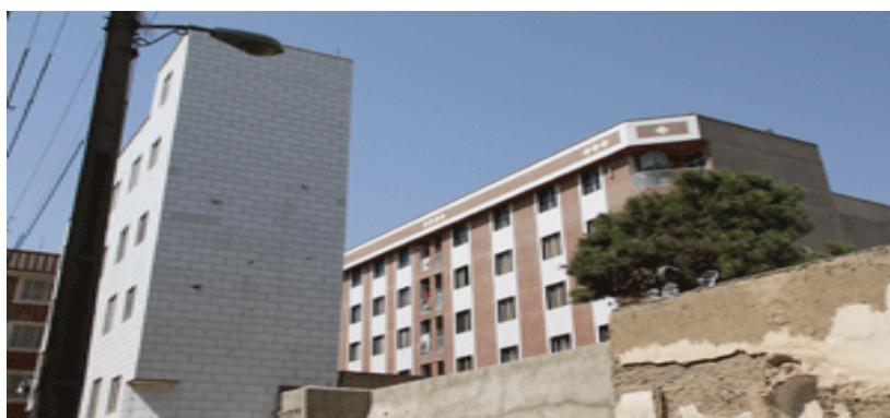
شکل ۱: منطقه ۱۲ تهران

آزمون همبستگی Kendallt تای نشان داد که میان تراکم و آلودگی صوتی و سلامت روانی شهروندان رابطه وجود دارد ( P = 0/01 ، r = 0/162 ). بر این اساس می‌توان گفت که هر چه قدر فضاهای شهری دارای آلودگی بیشتری باشد، به همان