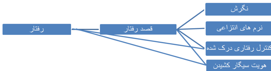
شکل ۱: نظریه رفتار برنامه‌ریزی توسعه یافته با هویت خود

در این مطالعه ۲۵۰ نوجوان سال اول تا سوم دبیرستان با میانگین سنی ۱۶/۲۱ سال و انحراف معیار ۱/۴۵ شرکت داشتند. ۳۷ درصد نمونه‌ها در کلاس اول، ۳۵ درصد از آن‌ها