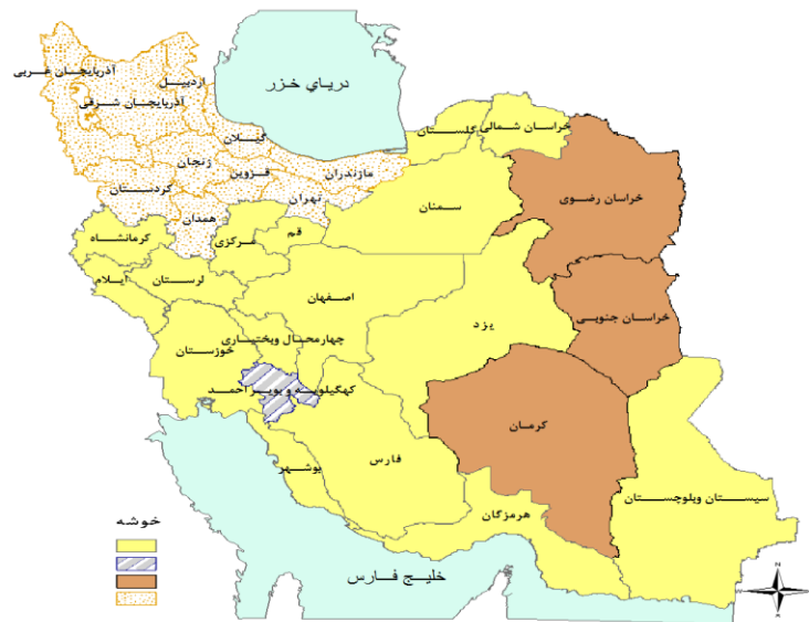
شکل ۲. خوشه‌بندی خطر نسبی سرطان معده با استفاده از آماره کاوسی فضا- زمان