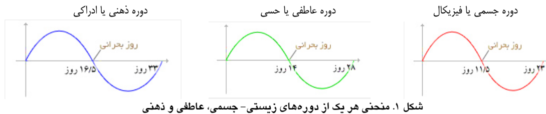
شکل ۱. منحنی هر یک از دوره‌های زیستی - جسمی، عاطفی و ذهنی

به قبل از محاسبه بیوریتیم برخوردار بوده است (۱۳). در تحقیق بر روی ۱۱۷۴ نفر از کارکنان شرکت برق ایرلند شمالی مشاهده شد که هماهنگی زیادی بین وقوع حوادث شغلی برای کارکنان و اتفاق دوباره آن حوادث در همان زمان شرایط قبلی وجود دارد و از بین افرادی که در روزهای بد خود دچار حادثه شده بودند و بیوریتیم آنان محاسبه نشده بود، ۱۵ درصد دوباره به حوادث شغلی گرفتار شدند که این حوادث به میزان ۴۰ درصد به دستگاه‌ها و تجهیزات صنعتی آسیب وارد ساخته است (۱۴). با توجه به این که خطاهای انسانی یکی از مهم‌ترین علل وقوع حوادث است، مدیران می‌توانند با بررسی و شناخت جنبه‌های فکری، جسمی و روحی کارکنان خود، بهترین و بدترین زمان برای انجام هر فعالیتی را در آینده پیش‌بینی کنند و از این طریق در کاهش حوادث ناشی از کار و پیامدهای آن‌ها بسیار مؤثر واقع شوند. از این رو مطالعه حاضر با هدف بررسی رابطه بین چرخه‌های سه‌گانه بیوریتیم با حوادث شغلی در صنایع فلزی شهر اصفهان انجام شد.