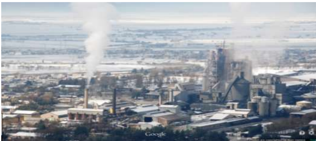
شکل ۱. منطقه مورد مطالعه (کارخانه سیمان دورود)

کارخانه سیمان دورود با طول و عرض جغرافیایی 33^{\circ}29'N و 49^{\circ}4'E در