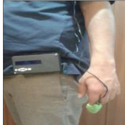
شکل ۳. دستگاه سنجش بار کاری فیزیکی

در مطالعه حاضر، توانایی شبکه‌های عصبی در تخمین دقیق شاخص‌ها، با تکنولوژی موجود در زمینه اندازه‌گیری ضربان قلب با یکدیگر تلفیق و منجر به ساخت دستگاهی شد که می‌تواند ضربان قلب را به طور مستقیم حین فعالیت ثبت کند و با مجموعه محاسبات برنامه‌نویسی شده بر روی برد (بر مبنای شبکه ANFIS) شاخص درصد VO_{2max} را تخمین بزند و بر مبنای آن بار کاری فیزیکی را تعیین نماید. از محدودیت‌های این روش می‌توان گفت که این مدل بر مبنای داده‌های حاصل از تست‌های آزمایشگاهی گروهی از مردان پدید آمد؛ بنابراین، نمی‌تواند جهت طبقه‌بندی بار کاری فیزیکی در زنان مورد استفاده قرار گیرد. هرچند بیشتر مشاغل نیازمند تلاش فیزیکی بالا از جمله آتش‌نشانی، کار در معدن، جنگل‌بانی،