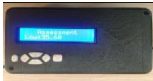
شکل ۴. نمونه‌ای از نتیجه نهایی ارایه شده توسط دستگاه سنجش بار کاری فیزیکی

جدول ۱، دو روش برآورد درجه بار کاری فیزیکی به وسیله دستگاه و با روش دستی را از نظر امتیاز کاربرپذیری سیستم و مدت زمان مورد نیاز مقایسه می‌کند. بیشترین و کمترین امتیاز کاربرپذیری ثبت شده برای دستگاه ساخته شده به ترتیب ۷۹ و ۹۵ و میانگین نمره کاربرپذیری این سیستم برابر با ۸۴/۶ برآورد گردید که مطابق با شکل ۲، در محدوده B و کاربرپذیری خیلی خوب قرار گرفت؛