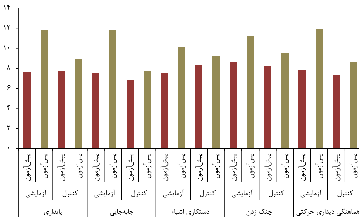
نمودار ۱: نمودار ستونی میانگین نمرات پیش‌آزمون و پس‌آزمون خرده‌مقیاس‌ها (به تفکیک دو گروه)