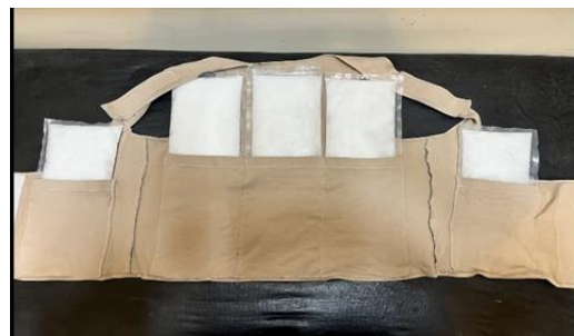
شکل ۱. نمایی از جلیقه خنک‌کننده سدیم سولفات ده آبه

جلیقه خنک‌کننده مورد استفاده دارای جنس لاکرا و پلی‌استر، متشکل از ۵ جیب حاوی بسته‌های خنک‌کننده تغییر فازی سدیم سولفات ده آبه همراه با مواد هسته‌ساز و ژله‌کننده (شکل ۱) با دمای تغییر فاز 24.3 درجه سانتی‌گراد و دمای نهان ذوب 249.7 کیلوژول بر کیلوگرم و وزن 210 کیلوگرم بود.