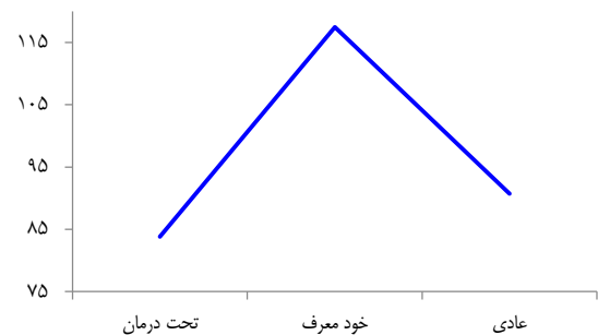
شکل ۲. تفاوت بین میانگین گروه‌ها در متغیر دشواری در نظم‌بخشی هیجانی