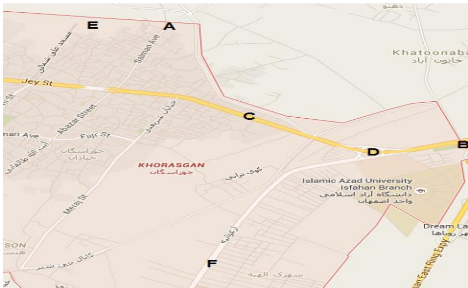
شکل ۱. نقشه منطقه با مشخص کردن نقاط نمونه‌برداری

کروماتوگراف (Gas chromatography یا GC) با دتکتور FID-CD (Agilent Technology-7890A، آمریکا) با دتکتور (Flame ionization detector-conductivity detector) آنالیز شد.