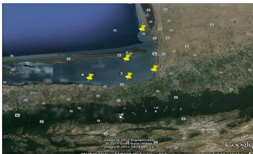
شکل ۲: ایستگاه‌های نمونه‌برداری در مصب رودخانه گرگانود و خلیج گرگان (تالاب بین‌المللی و پناهگاه حیات وحش میانکاله)

در آزمایشگاه به مقدار ۵ گرم از رسوب خشک شده را در کوره با دمای ۴۰۰ درجه سانتیگراد به مدت نیم ساعت قرار داده شد. سپس مقداری اسیدکلریدریک (۱:۱) به آن افزوده شد و در بنماری در حرارت ۸۰ درجه سانتیگراد به مدت یک ساعت قرار گرفت. بعد از صاف کردن، محتویات روی کاغذصافی را طی سه مرحله تحت اثر اسیدکلریدریک و اسیدفلوریک قرار داده شد. سپس در بنماری تحت حرارت ۷۰ درجه سانتیگراد قرار گرفت. در پایان نمونه‌ها بعد از عبور از صافی با آب غیر یونیزه به حجم ۵۰ سی‌سی رسانده شد. سپس توسط دستگاه جذب اتمی میزان غلظت فلزات مورد نظر ثبت گردید (۱۲). در این تحقیق برای مقایسه غلظت فلزات سنگین در ایستگاه‌ها با یکدیگر از آزمون اختلاف میانگین (Duncan) در نرم‌افزار SPSS ۱۶ استفاده گردید.