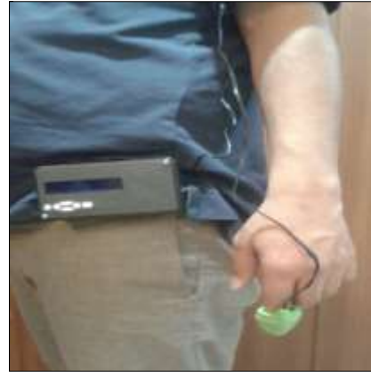
شکل ۳. دستگاه سنجش بار کاری فیزیکی

در مطالعه حاضر، توانایی شبکه‌های عصبی در تخمین دقیق شاخص‌ها، با تکنولوژی موجود در زمینه اندازه‌گیری ضربان قلب با یکدیگر تلفیق و منجر به ساخت دستگاهی شد که می‌تواند ضربان قلب را به طور مستقیم حین فعالیت ثبت کند و با مجموعه محاسبات برنامه‌نویسی شده بر روی برد (بر مبنای شبکه ANFIS) شاخص درصد VO_{2max} را تخمین بزند و بر مبنای آن بار کاری فیزیکی را تعیین نماید. از محدودیت‌های این روش می‌توان گفت که این مدل بر مبنای داده‌های حاصل از تست‌های آزمایشگاهی گروهی از مردان پدید آمد؛ بنابراین، نمی‌تواند جهت طبقه‌بندی بار کاری فیزیکی در زنان مورد استفاده قرار گیرد. هرچند بیشتر مشاغل نیازمند تلاش فیزیکی بالا از جمله آتش‌نشانی، کار در معدن، جنگل‌بانی،