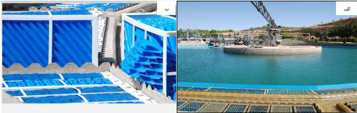
شکل ۱. نمای ته‌نشین‌کننده‌های لوله‌ای در کلاریفایرهای مورد بررسی الف. نمای ته‌نشین‌کننده‌های لوله‌ای و ب. موقعیت قرارگیری ته‌نشین‌کننده‌های لوله‌ای

غلظت TSS خروجی در کلاریفایرهای مجهز به ته‌نشین‌کننده‌های لوله‌ای، ۳/۲۰ میلی‌گرم بر لیتر و در کلاریفایرهای بدون ته‌نشین‌کننده‌های لوله‌ای، ۴/۴۱ میلی‌گرم بر لیتر به دست آمد. میانگین راندمان حذف TSS در کلاریفایرهای مجهز به ته‌نشین‌کننده‌های لوله‌ای، ۶۴/۸۶ درصد و در کلاریفایرهای دیگر، ۵۲/۱۰ درصد بود. همچنین، تعداد دفعات شستشوی معکوس ده صافی دریافت‌کننده خروجی کلاریفایرهای مجهز به ته‌نشین‌کننده‌های لوله‌ای، ۱۲ بار در روز و در ده صافی مرتبط با کلاریفایرهای دیگر، ۱۶ بار در روز گزارش گردید. میانگین انرژی مصرفی روزانه شستشوی صافی‌های دریافت‌کننده خروجی کلاریفایرهای مجهز به ته‌نشین‌کننده‌های لوله‌ای، ۱۸۸ کیلووات ساعت در روز و در سایر کلاریفایرها، ۳۹۳ کیلووات ساعت در روز بود.